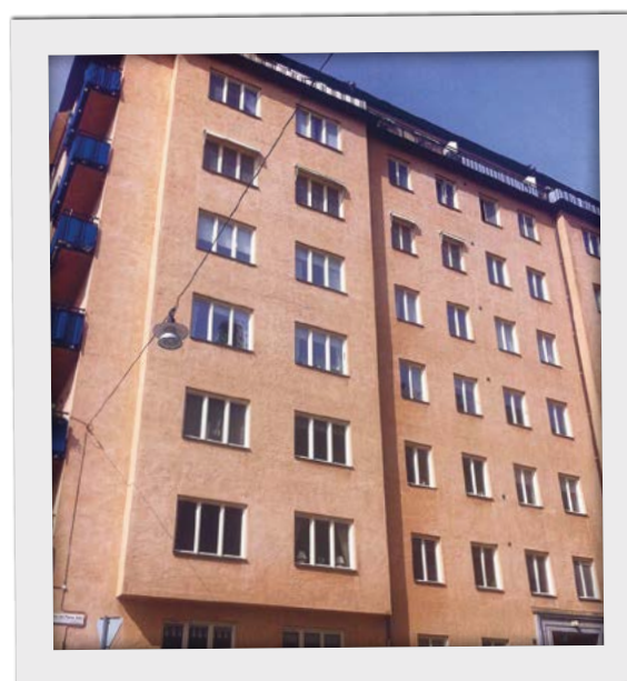
Snabb och enkel montering!