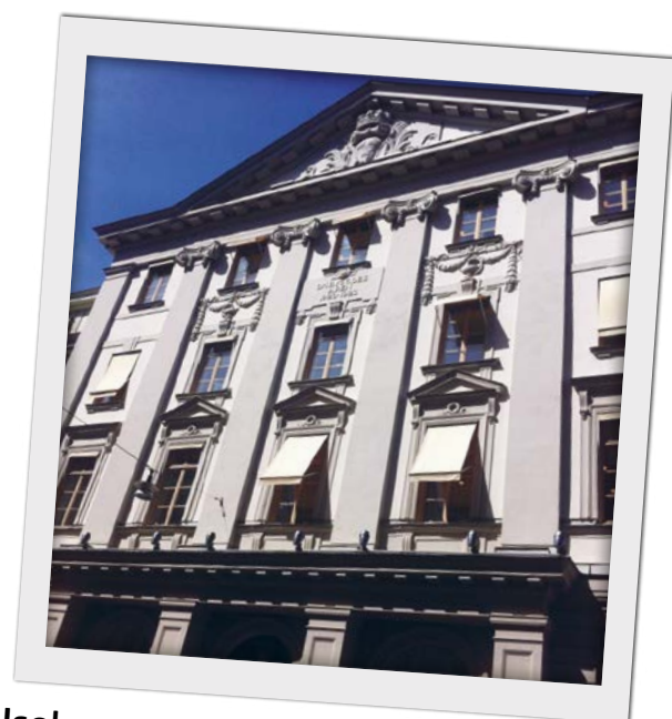
Isolerrutan passar alla typer av fönster